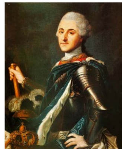
Stanisław August Poniatowski (*1732 †1798), król Polski w latach 1764–1795. W chwili objęcia władzy miał 32 lata. Był człowiekiem wszechstronnie wykształconym, znał kilka języków. Interesował się kulturą i sztuką.

Szkoła Rycerska mieściła się w dawnym letnim pałacu króla Jana Kazimierza. Uczęszczała do niej młodzież szlachecka. Szkoła nie tylko miała wysoki poziom nauczania, lecz także uczyła patriotyzmu. Jej wychowankom wpajano, że służba ojczyźnie to ich podstawowy obowiązek. Gmach szkoły został uwieczniony na obrazie z 1785 roku.